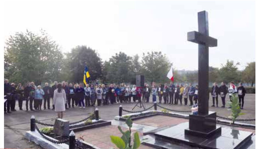
Při příležitosti 80. výročí popravu uctili památku zavražděných Čechů v Žitomiru obyvatelé města a zástupci Ústavu pro studium totalitních režimů i velvyslanectví České republiky na Ukrajině. Při této příležitosti byla na místě bývalého masového hrobu u památníku obětí Velkého teroru odhalena opravená pamětní deska připomínající jejich památku.