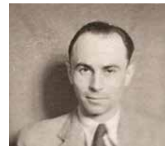
Jan Kudlič